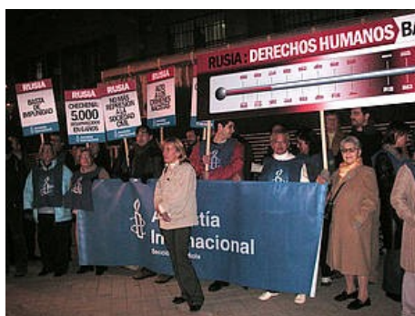
Ilustración 4: Manifestación de Amnistía Internacional en España, con mujeres al frente