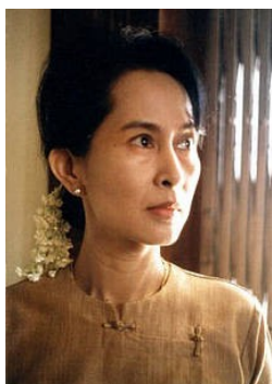
Ilustración 6: Retrato Aung San Suu Ky, coordinadora de la Liga Nacional para la Democracia de Myanmar