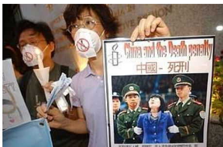
Ilustración 2: Mujer sosteniendo un cartel en contra de la pena de muerte en China