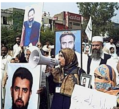
Ilustración 3: Mujeres encabezando una manifestación y hablando por megáfono en una movilización de protesta contra las desapariciones forzadas en Pakistán